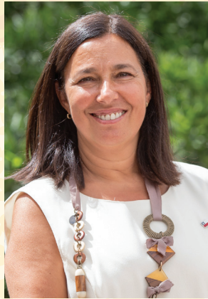
Pauline Kantor Pupkin Ministra del Deporte de Chile

Lima 2019 es la antesala de los Panamericanos y Parapanamericanos de Santiago 2023, momento en el que recibiremos con orgullo esta cita continental, de la que us-